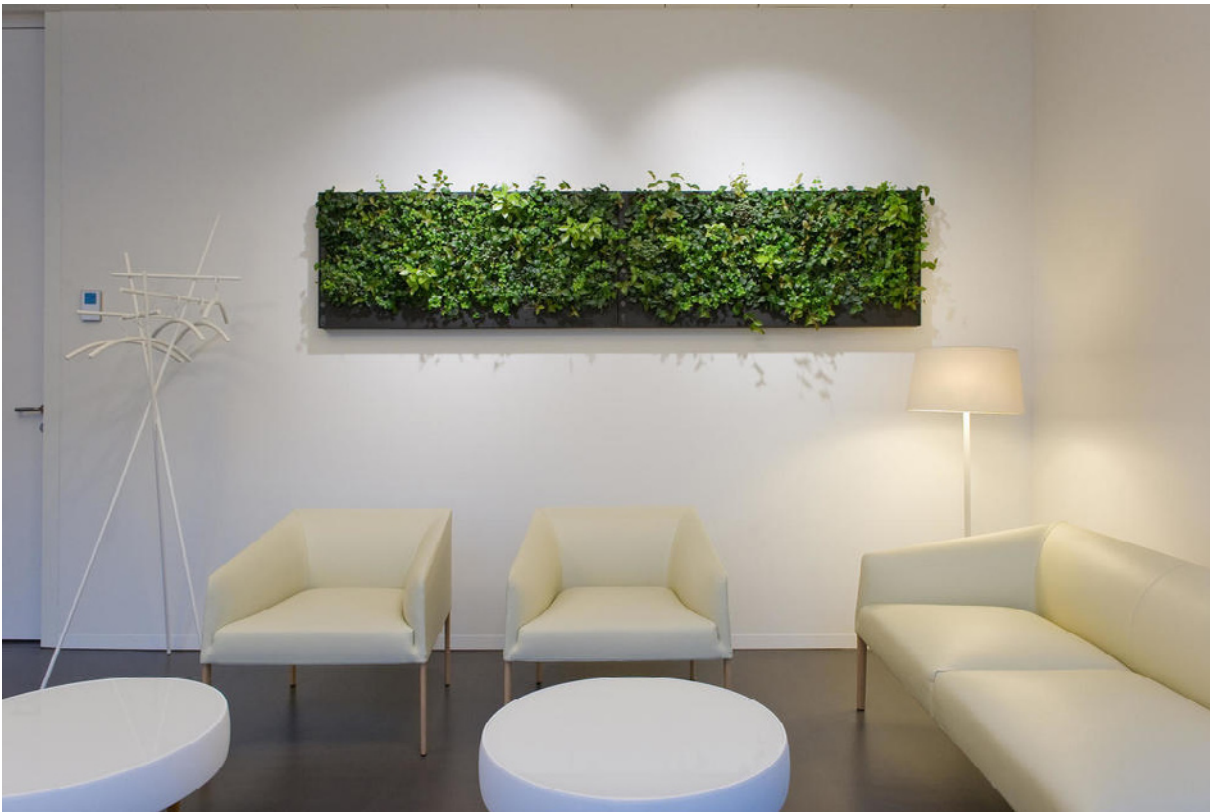
HerzKlinik Hirslanden, Zürich: Verticalis Bild