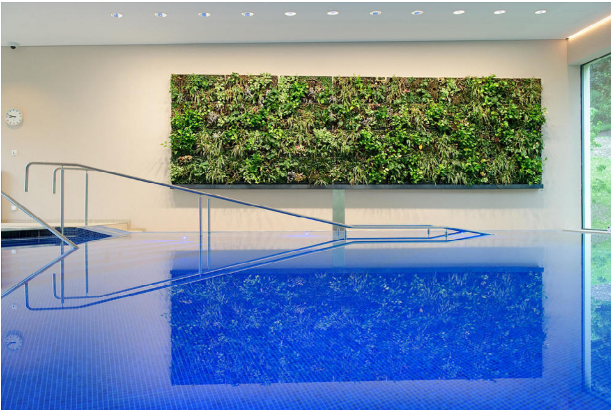
kneipp-hof Dussnang AG | Monumentales Pflanzengemälde im Therapiebad