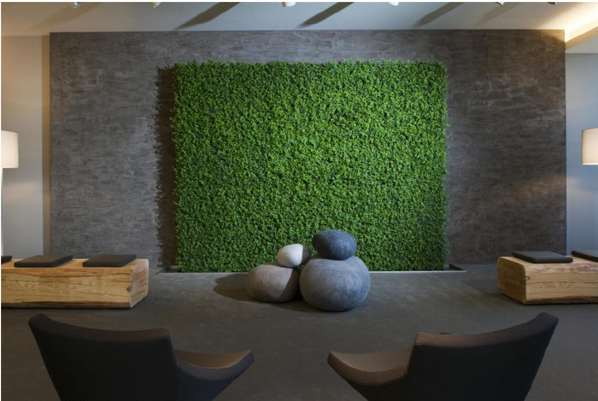
Wellnesshotel Golfpanorama, Lipperswil