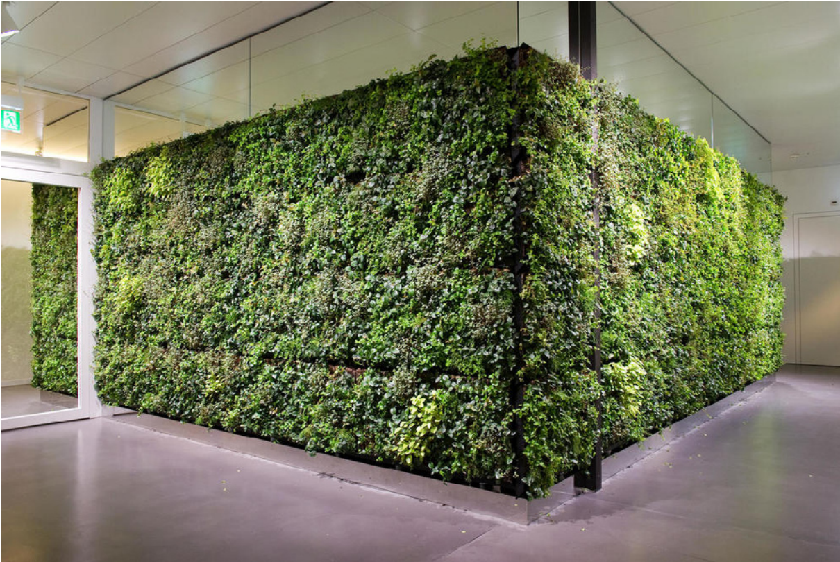
HerzKlinik Hirslanden, Zürich: Grünkörper