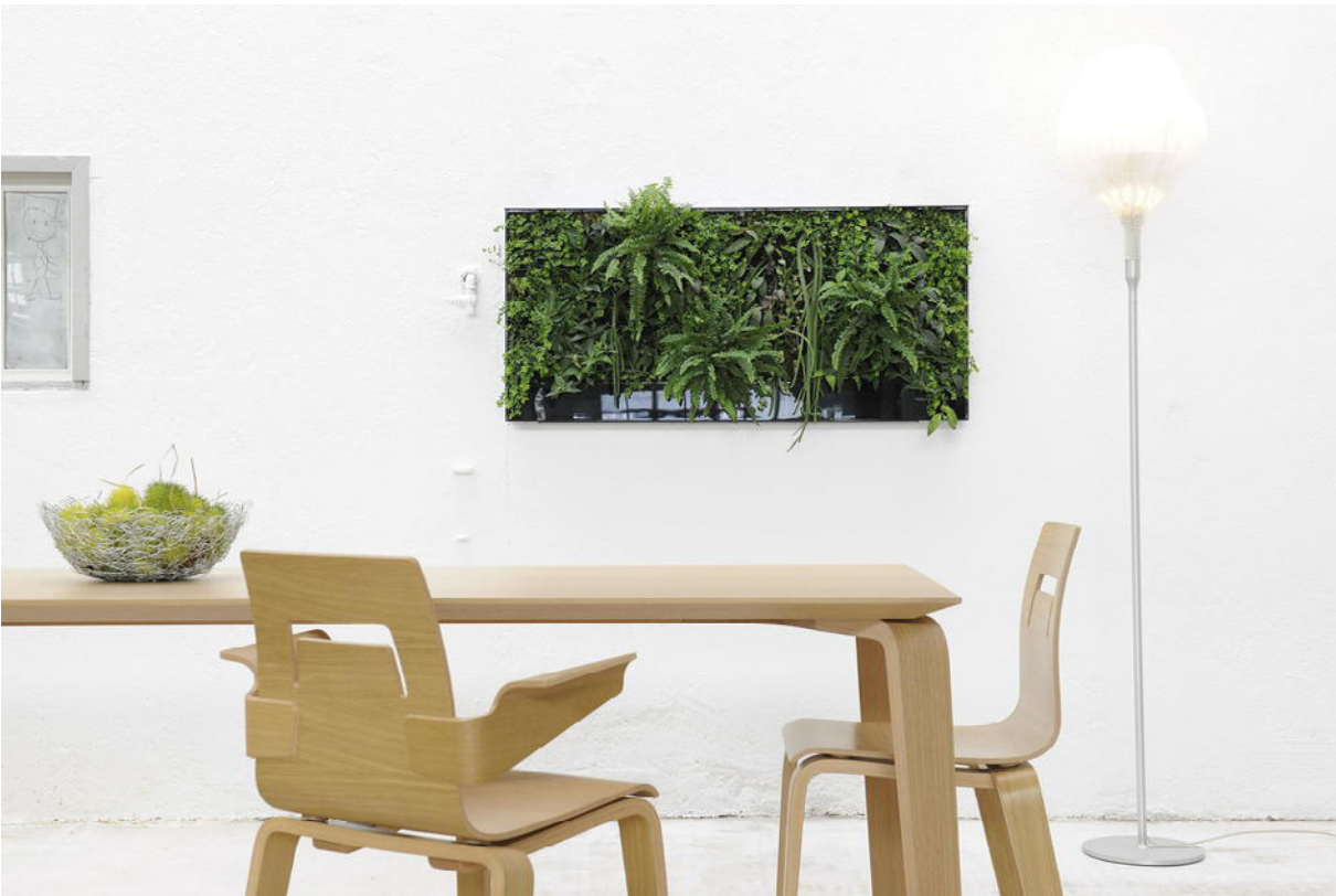
Verticalis bei Christophe Marchand