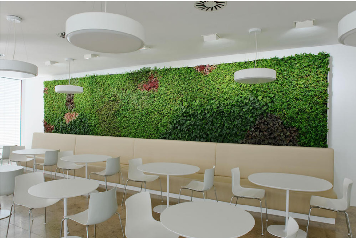
F. Hoffmann- La Roche AG, Kaiseraugst | Monumentales Pflanzengemälde in der Cafeteria