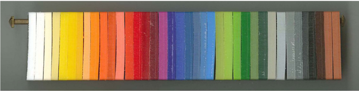
Farbmuster der Grundplatte