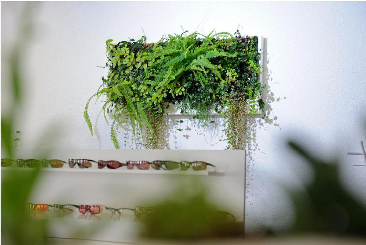
Verdieri Optik, Winterthur